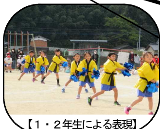
【1・2年生による表現】

前年度同様、 ①実施可能な限りの感染対 策のもとで ②種目・係等の内容を見直し ③保護者観覧テント・席の撤 去等の対策を行い、 保護者、地域の方々のご理解 とご協力のおかげで無事行 うことができました。 本当にありがとうございます。