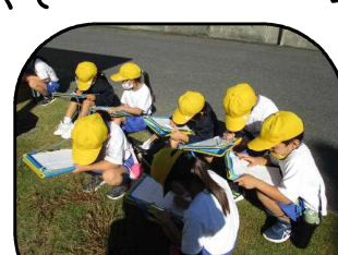
【1年生おきこいりさがし】