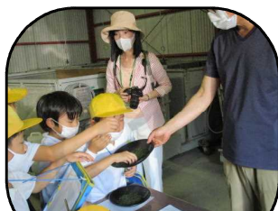
【3年生お茶工場見学】