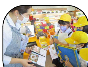
【2年生まちたんけん】