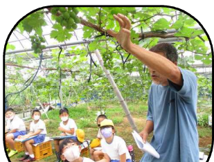
【4年生ぶどう袋がけ】