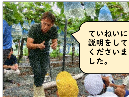
ていねいに説明をしていただきました。