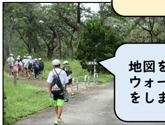
地図を持って、ウォークラリーをしました。