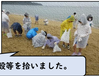
海岸で貝殻等を拾いました。

二日間の活動を通して、一つ一つの活動で、困難を乗り越え、成長することができました。