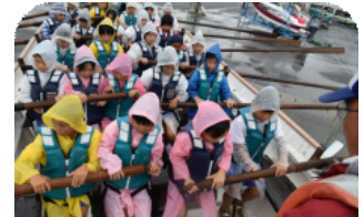
【宿泊体験学習カッター体験】